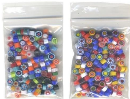
透明ミックス 不透明ミックス

広沢七宝オリジナルのミルフィオリ(ミックス)です。直径は約4mm(画像は縮小)です。